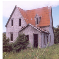
La Maison Dingwell

L'Île Brion a été découverte par Jacques Cartier en juin 1534. L'Île fût habitée pendant les années 1800-1900, principalement par les gardiens du phare et la famille Dingwell. Après que l'Île fût désertée par les habitants en permanence elle est devenue habitée saisonnièrement par des pêcheurs jusqu'au début des années 1970.