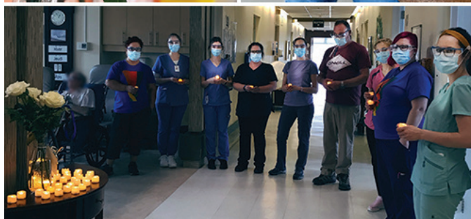
La séance commémorative du 11 mars 2021, au Jeffery Hale et à Saint Brigid's Home.