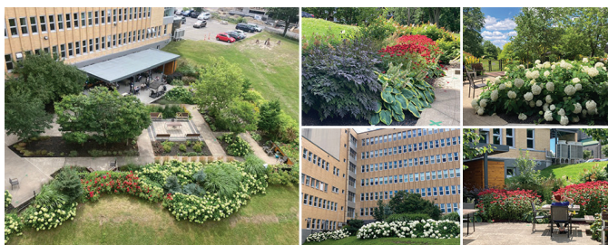
Le jardin de la terrasse du Jeffery Hale.

Merci à toute l'équipe des préposés en hygiène et salubrité pour son dévouement et sa conscience professionnelle axée sur le bien-être des résidents.