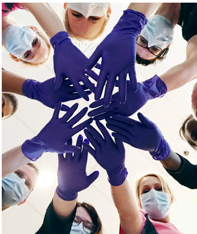
Une photo de groupe lors de la formation sur la maltraitance.