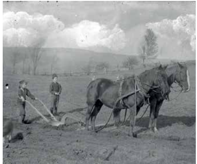
Photo 1: Deux jeunes garçons qui labourent le champ