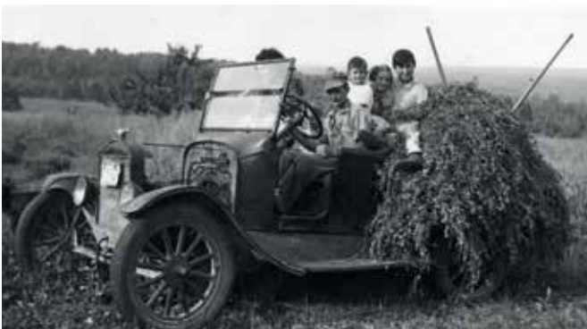
Photo 3: Apportant le foin dans les années 1940-1950