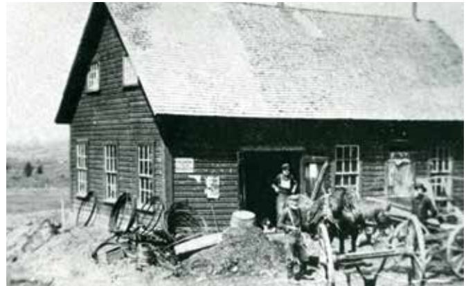
Photographie 6: Station d'écumage de lait de Nelson Fish, construite en 1893 à Minton / Centre de ressources pour l'étude des Cantons-de-l'Est / Reginald Conner fonds P046_004