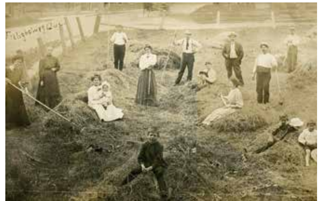
Photograph 2: Carte postale montrant des hommes, des femmes et des enfants dans un pâturage de foin vers les années 1910, à Frelighsburg