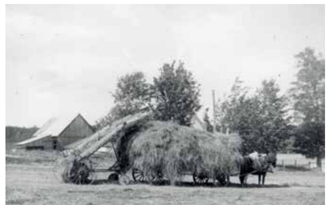
Photograph 4: Utiliser un chargeur de foin