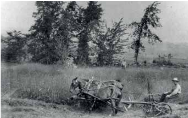
Photograph 5: Tondre le foin