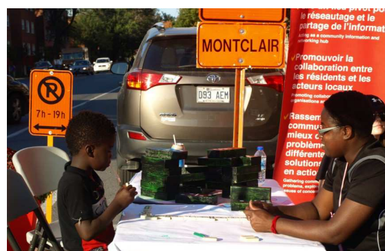
Parking Day 2017—Fielding-Walkley

Park(ing) Day est un festival international conçu pour célébrer les choix quotidiens en matière de mobilité durable et pour plaider en faveur d'équipements urbains favorables en prenant le contrôle d'une place de stationnement. Saint-Raymond, Benny et Walkley ont tenu leur propre version éclectique de Parking Day; des cafés, des stands de hot-dogs, des stations d'art et d'artisanat et un jeu de dominos! Tous les rassemblements reflétaient ce que les résidents voulaient voir davantage dans le quartier. Les trois locations ont reçu un total de 150 résidents du secteur.