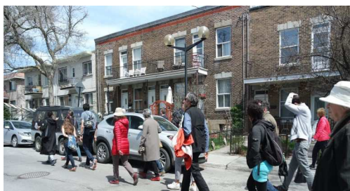
Jane's Walk- St-Raymond

Chaque année, le conseil communautaire de NDG organise un nombre de festivités de quartier dans chaque secteur prioritaire. Des acteurs et partenaires clés de la communauté se réunissent pour organiser un événement pour les résidents désireux de passer un bon moment entre voisins. Les résidents sont impatients d'assister à ces événements qui offrent de multiples occasions d'engagement communautaire tout au long de l'année. En 2017, les quatre secteurs prioritaires ont tenu leur propre événement, comme le Festival de la moisson de St-Raymond, le BBQ communautaire de Benny, la Fête de quartier Westhaven- en conjonction avec le Dépôt Alimentaire - Picnic Bonne Bouffe et la fête de quartier de Walkley. Au total, 519 résidents ont été rejoints.