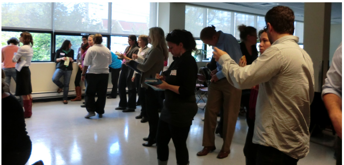
Table Ronde 2012

Afin de fournir aux acteurs les moyens de bien saisir les enjeux et la situation actuelle dans NDG, un statisticien externe a été engagé afin de développer le profil de la communauté. (Veuillez consulter notre site Internet afin d'accéder à ce document)