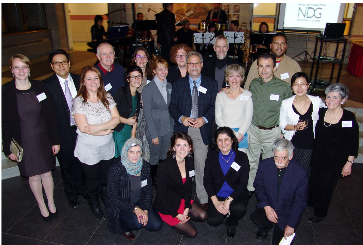
70 e anniversaire