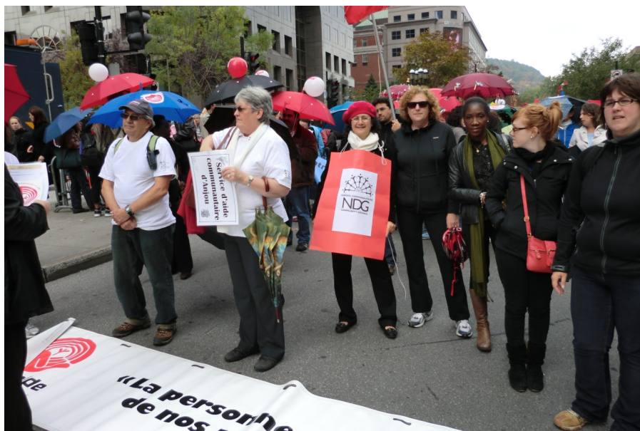
MARCHE DE CENTRAIDE 2012

MICC- Ministère de l'Immigration et des Communautés Culturelles