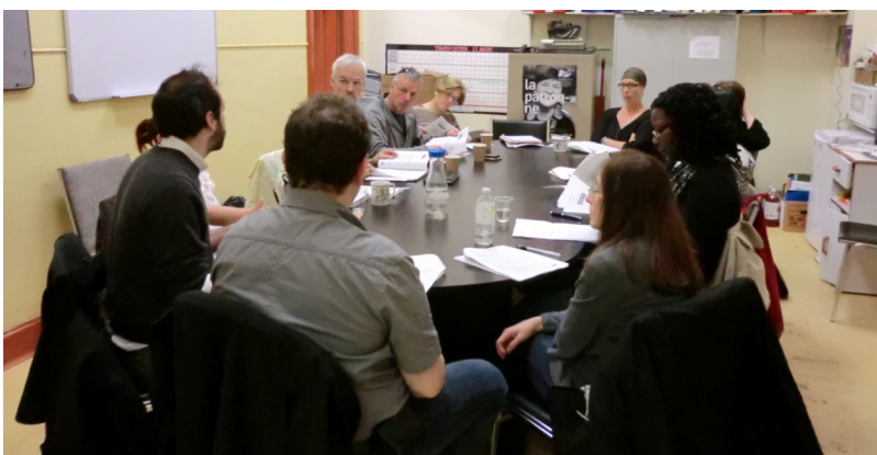
Table de concertation sur la sécurité alimentaire

En lien avec ce travail, le Conseil continue de participer aux travaux du Comité d'arrondissement supervisant la revitalisation de trois installations de NDG : Le Centre Le Manoir, le Centre communautaire Notre-Dame-de-Grâce et la Piscine intérieure de Notre-Dame-de-Grâce. Le rôle du Conseil est d'assurer l'arrimage des besoins de la coalition avec les enjeux ayant été discutés au sein de ce comité.