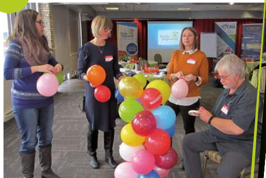
Les partenaires de Bright Beginnings de Gaspé – Îles-de-la-Madeleine lors d'une rencontre régionale de collaboration le 23 janvier 2019.